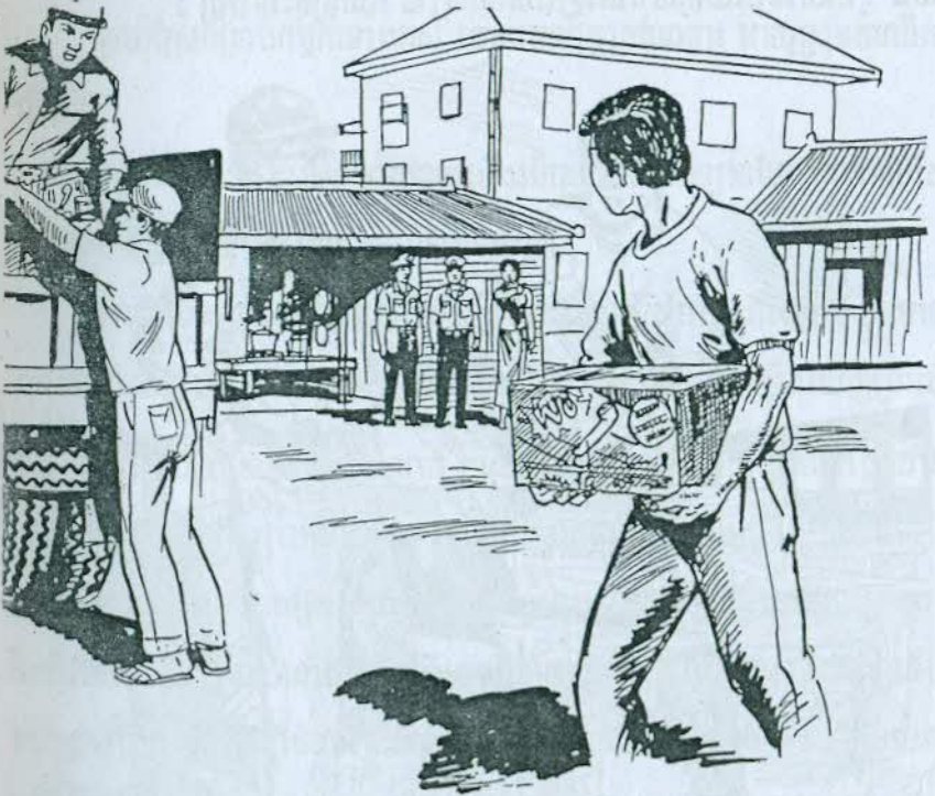
បណ្តើរសើចចុកពោះបណ្តើរ ។

ពូជ្យសំឡក់សារ៉ាន់មិនទាន់បាត់ក្តៅនៅឡើយ តែគាត់មាននិស្ស័យជាមនុស្សមិនបង្ការរឿងក៏សុខចិត្តនៅស្ងៀមទៅ ។ នាយមើងសូហ្វ័រឡាន រៀបអីវ៉ាន់ឈឺឡាន