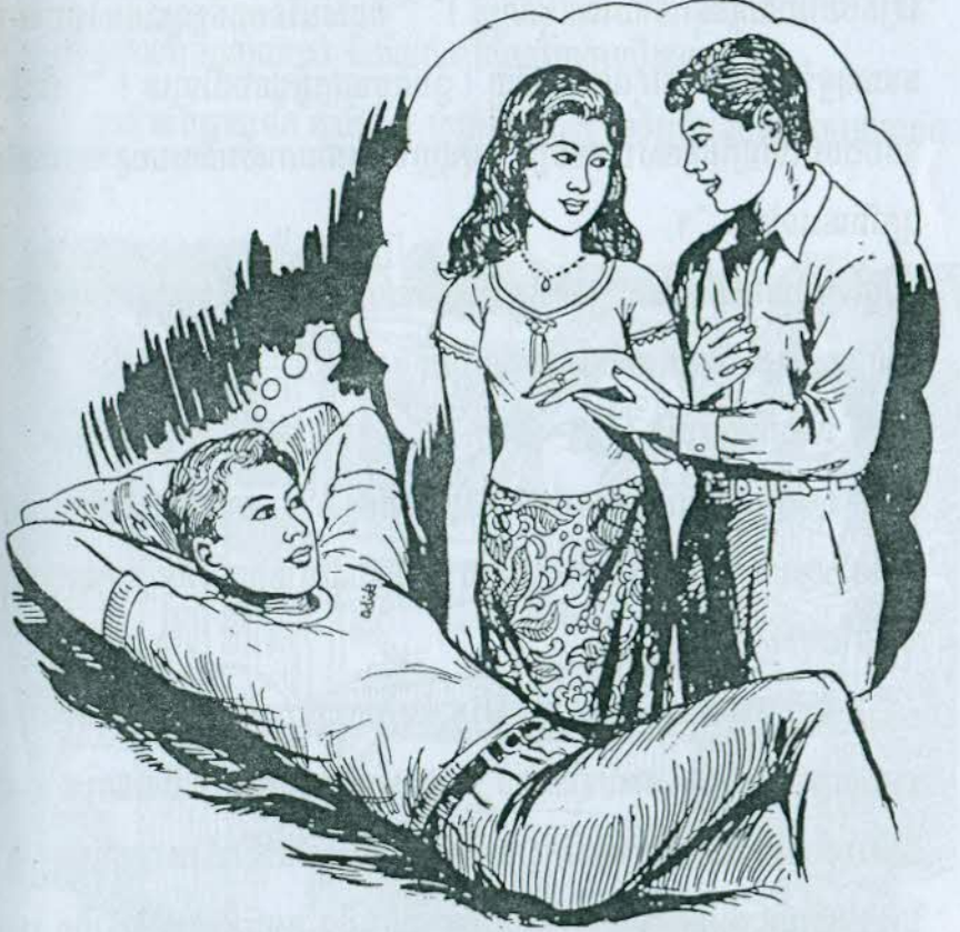
ក្រោយនោះទេអោយប្រញាប់ពេក ចិញ្ចៀនជាអំណោយរបស់ខ្ញុំចំពោះនាង វានិមិត្តាន

- បងម៉ាទមិនតោសអោយខ្ញុំទេ ព្រោះព្រឹកមិញខ្ញុំឈ្មោះជាមួយគាត់ - ឯងនេះចោលម្សៀតណាស់ ដើរតែទាស់ជាមួយគេសឹងគ្រប់គ្នា ។ សំដីពួកឆ្មាំចុងក្រោយ ធ្វើអោយសារ៉ាន់ឈប់និយាយតជាមួយពួកទៅទៀត ។ សារ៉ាន់ក៏បង្វែរអារម្មណ៍ ទៅរកកាំភ្លើងខ្លី ដែលគេលាក់ទុកក្នុងឡាំងឈើក្រោយឃ្នាំង... បើខ្ញុំលក់កាំភ្លើងនេះបានប្រាក់ ៥០ដុល្លារ ខ្ញុំយកលុយនេះទៅទិញជញ្ជ័នមួយវែងទុកអោយអ្ននណេតពាក់ពេលបុណ្យភ្នំនេះ ។ ប៉ុន្តែខ្ញុំមិនមែនយកទៅអោយនាងគ្រង